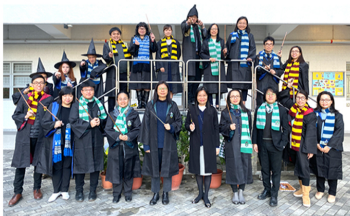
▲ Master Wizards assemble!

A highly-enriched school-wide English language environment is achieved through a variety of interactive activities and programmes: S3 English drama elective, S4 Debate, international learning opportunities, English Lunchtime Café, participation in the Hong Kong Schools Festivals, theme-based English activities, student-run newsletter "Elegantianism", student-hosted English morning assemblies, integration programmes to English-speaking countries.