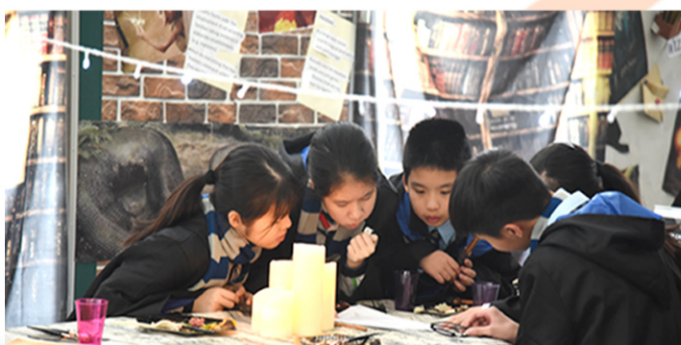
▲ Serious intellectuals make short work of challenging questions