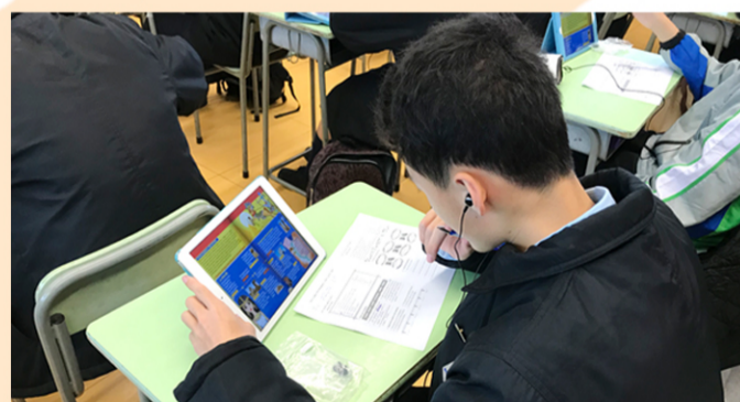
▲ E-books go well with morning reading

A tried-and-true English morning reading programme founded on a broad selection of contemporary texts and resources, as well as a heavy emphasis on reading across the entire curriculum, provides students with the initiative to actively explore the wonders of written English.