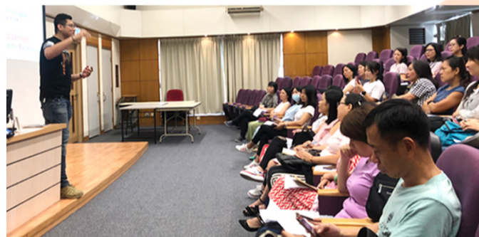
▲ Parents are diligent learners too, you know

A highly acclaimed English Language Teaching (ELT) Parents' Workshop series for Secondary 1 parents on reading strategies, English literature, and phonics is held every year to promote and facilitate a welcoming whole-family approach of extensive learning and reading.