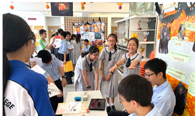
▲ They can sing and they can dance, they do thrive at Halloween

Meticulously tailored classes in terms of size and diversity, specifically planned and executed English lessons, e-learning resources, cross-curricular activities, and after-school enhancement / support sessions all aim to maximise teaching and learning effectiveness.