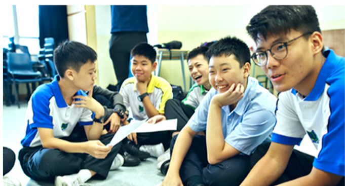
▲ Lots of thinking and lots of joy at Drama Day Camp

HKEDB-approved EMI classes offered throughout Junior Secondary years, along with the adoption of English as the medium of instruction for all in both Science and Mathematics in junior secondary curriculum, provide students with a multi-spectrum exposure to the English language in various learning areas early on.