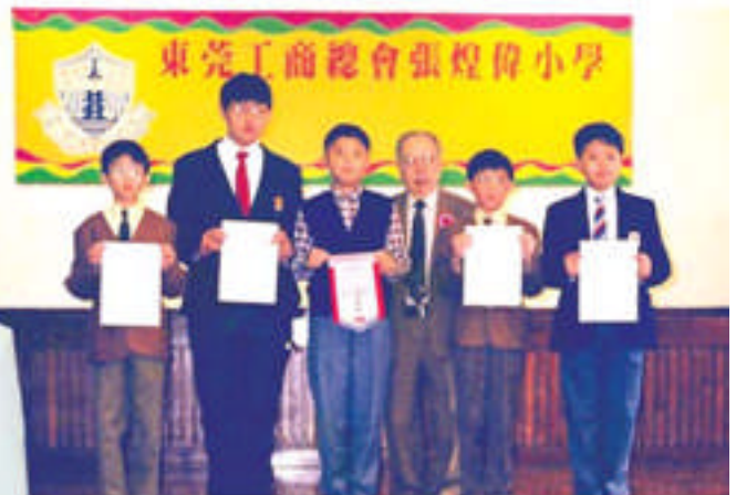
詩詞獨誦普通話男子亞軍