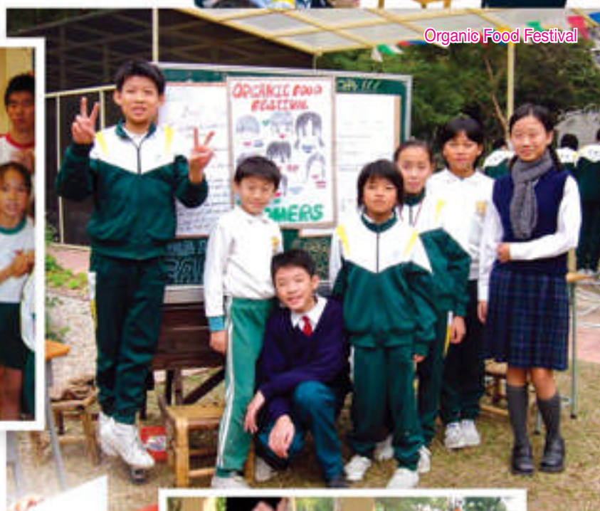
Organic Food Festival