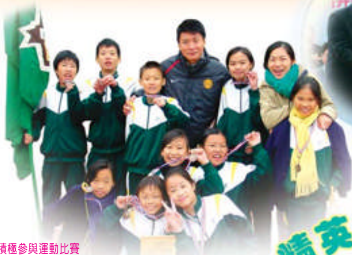
積極參與運動比賽