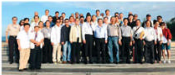
2009年7月5-8日，臺灣訪問團成員與本會榮譽會長梁振英GBS太平紳士合照於張德熙會長臺北縣澳底的海濱地產項目。

新界總商會創於一九五九年五月十一日，本會宗旨；堅持愛國、愛港、愛鄉。促進香港內地經濟；就維護工商界的正當經營和合法權益；向特區政府建言獻策，加強國內外工商界的交流合作以謀求共臻繁榮。