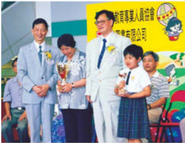
首屆全港小學漢語故事演講比賽季軍