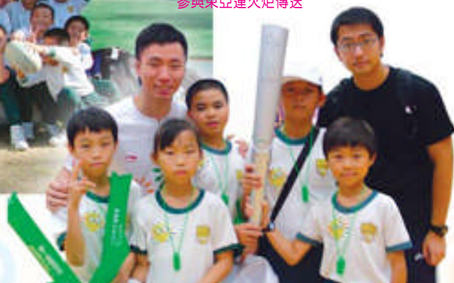
參與東亞運火炬傳送