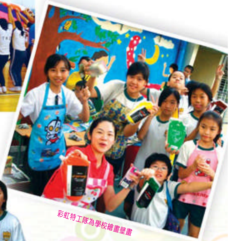
彩虹特工隊為學校繪畫壁畫