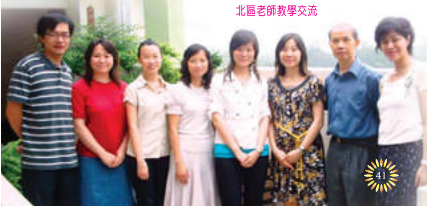
北區老師教學交流