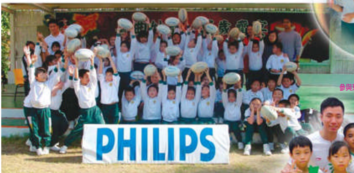
飛利浦小型檯球計劃