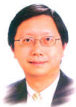
教育局常任秘書長 黃鴻超太平紳士