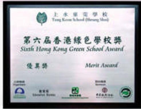
第八屆綠色學校優異獎