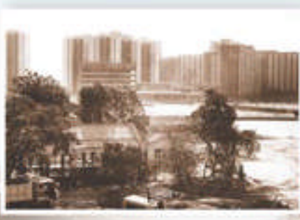
政府拓展上水新市鎮， 1989年清拆學校附近農舍。