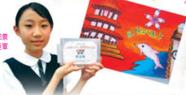
回歸十年郵票 設計比賽亞軍