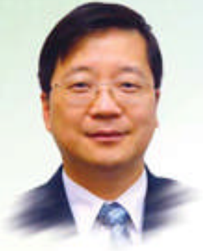
教育局首席教育主任（新界） 梁兆強先生