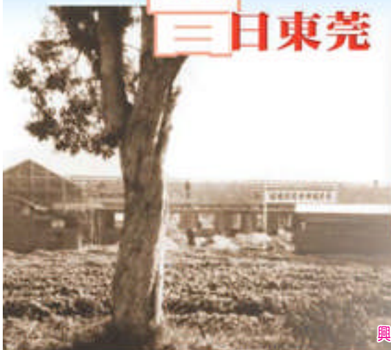
興建中的東莞學校