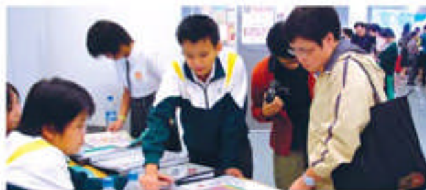
學生在飛躍學習舞台中負責講解