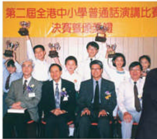
第二屆全港小學漢語故事演講比賽亞軍