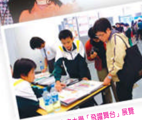
參加中文大學「飛躍舞台」展覽