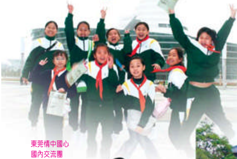
東莞情中國心 國內交流團