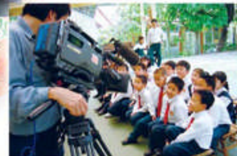
香港電台專訪本校