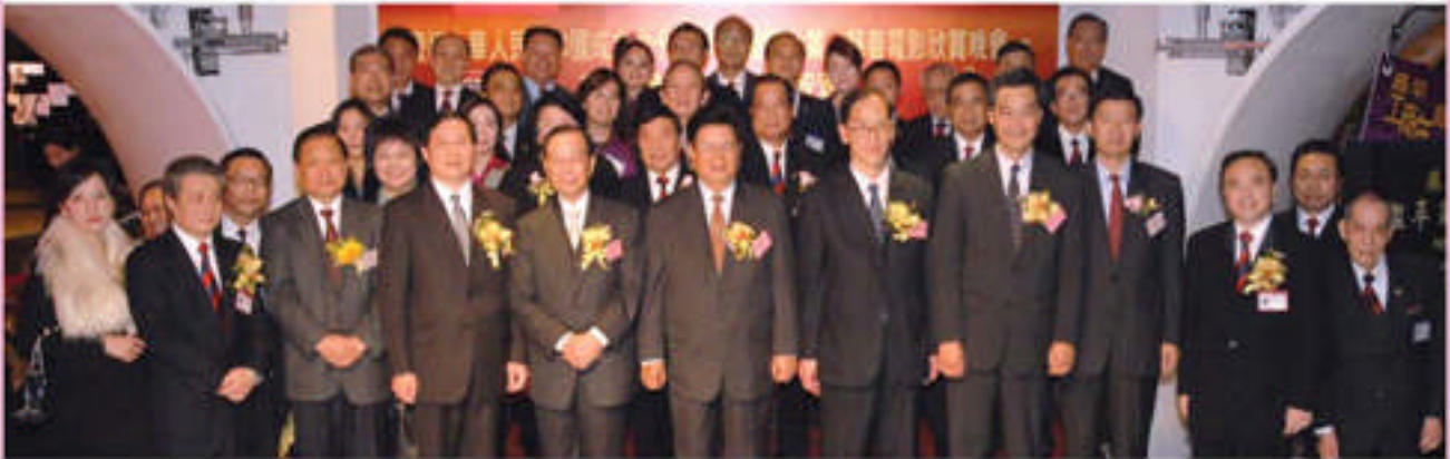
2009年12月10日，本會於圓方商場舉行慶祝中華人民共和國成立六十週年及「建國大業」慈善電影欣賞晚會暨新界總商會五十金禧會慶及社會服務基金開啟禮。

新界總商會創於一九五九年五月十一日，本會宗旨；堅持愛國、愛港、愛鄉。促進香港內地經濟；就維護工商界的正當經營和合法權益；向特區政府建言獻策，加強國內外工商界的交流合作以謀求共臻繁榮。