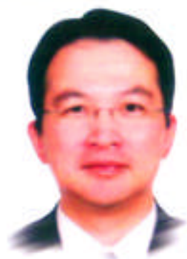
漁農自然護理署助理署長 薛漢宗先生