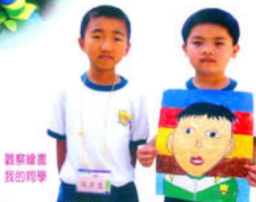
觀察繪畫我的同學