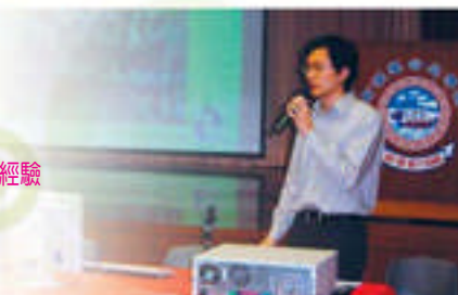
分享網上校報製作經驗