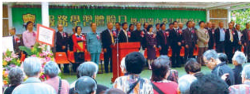
10/2/2007舉辦服務學習體驗日暨田園小學開放日，招待200名長者到校參觀。