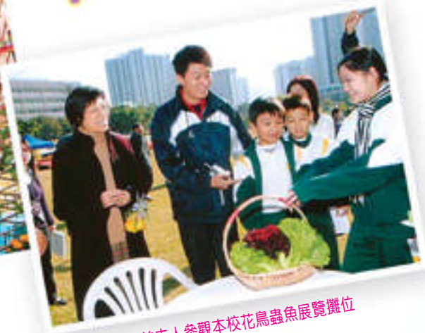
特首夫人參觀本校花鳥蟲魚展覽攤位