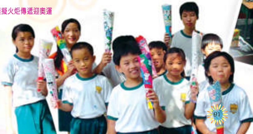
模擬火炬傳遞迎奧運