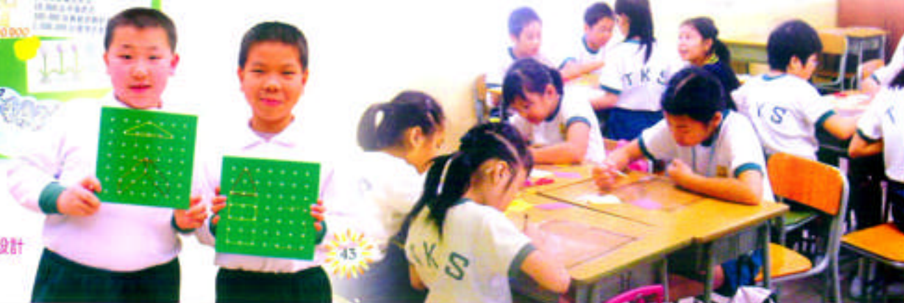
實作評量-釘板圖形設計