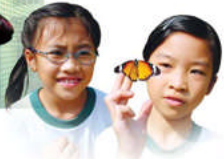
學生釋放飼養的金斑蝶