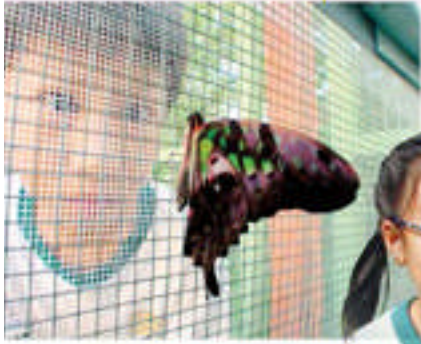
統帥青鳳蝶羽化了