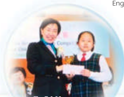
English Verse Speaking Competition