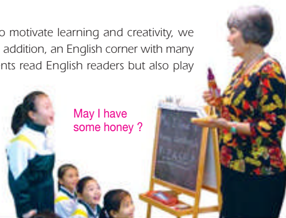
May I have some honey ?

To provide greater opportunities for students to use English outside the classroom, we arrange for them to attend English activities organized by other schools. Students can learn English in interesting ways.