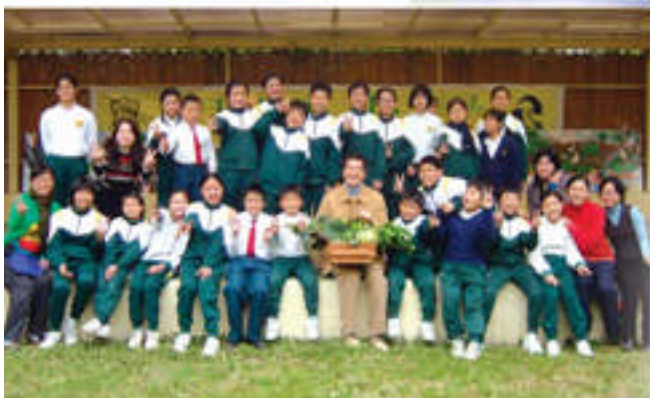
無線電視為本校優質教育基金計劃拍攝宣傳特輯