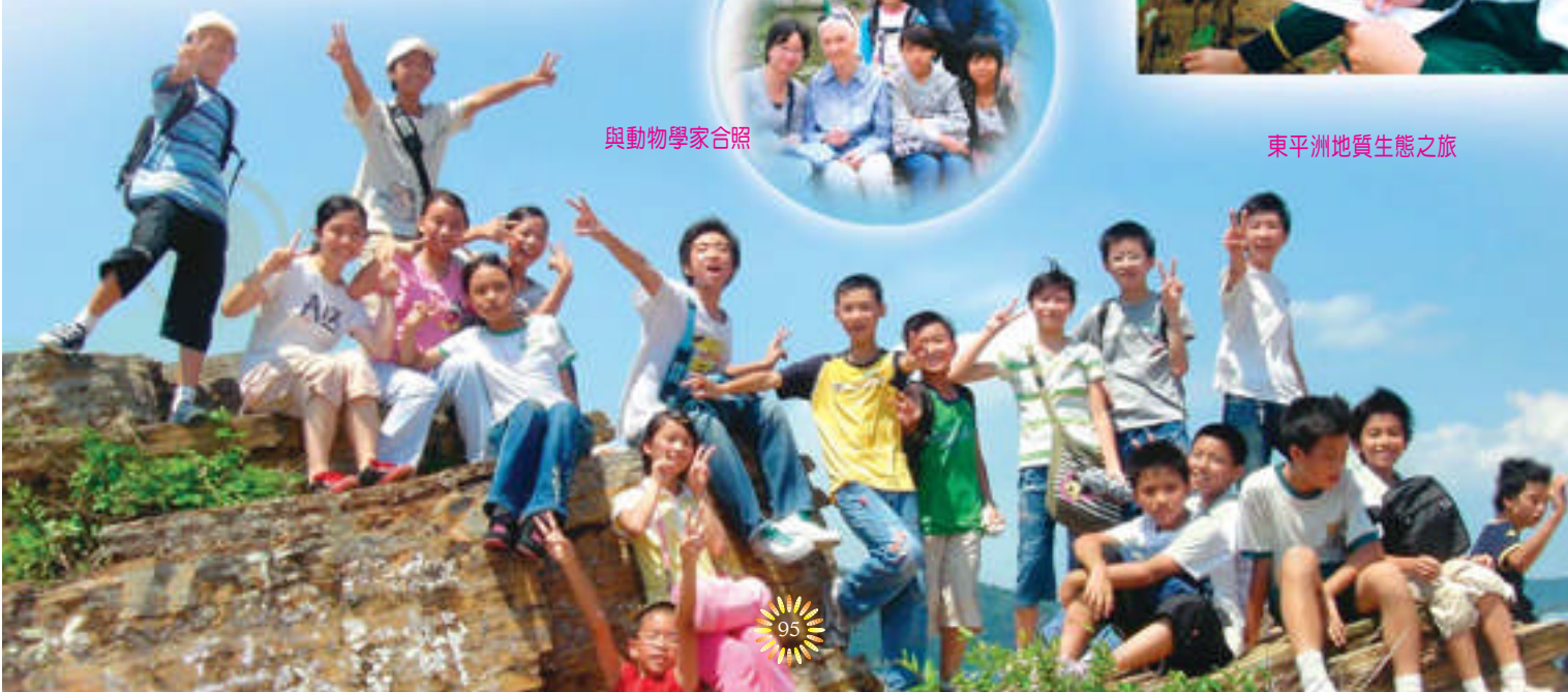
東平洲地質生態之旅