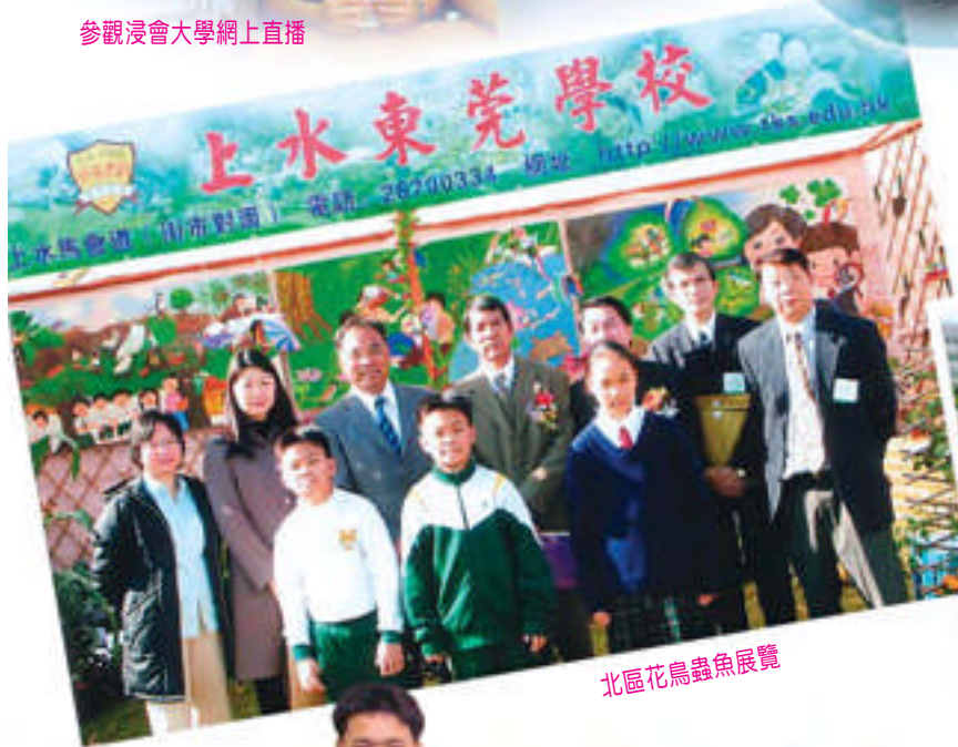
北區花鳥蟲魚展覽