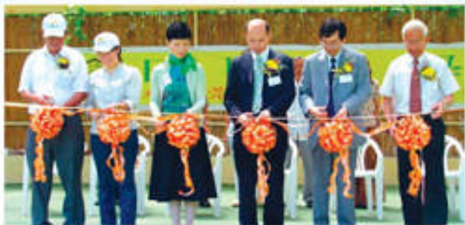
田園小學開幕典禮