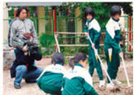
無線電視為本校優質教育基金計劃 拍攝宣傳特輯