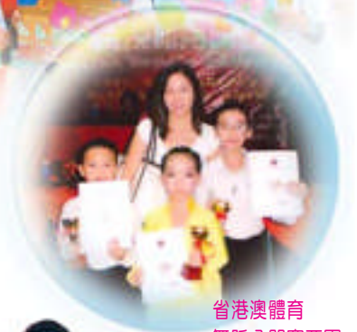
省港澳體育 舞蹈公開賽亞軍