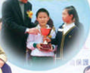
全港書籤 比賽季軍