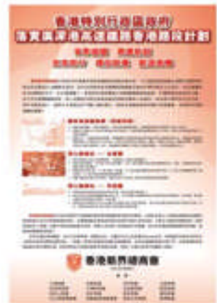
2009年10月22日，本會於香港經濟日報及星島日報刊登全版歡迎特首聯同行政會議落實港深高速鐵路香港站的項目方案。

仁在歷次全國人大、政協委任和香港特區歷年授勳典禮中，成績彪炳；計有：全國人大常委1人、全國政協常委5人、全國人大代表7人、全國政協委員12人；特區大紫荊勳章2人、金紫荊星章12人、銀紫荊星章8人、銅紫荊星章16人、榮譽勳章20人、行政長官社區服務獎狀7人，獲委太平紳士多人。