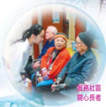
服務社區 關心長者