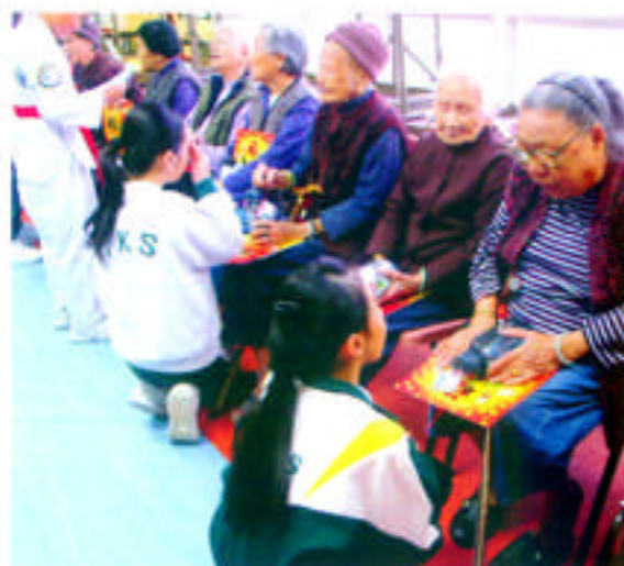
關愛天使探訪老人院

我們認為學生是可教的，清晰的獎懲指引能鼓勵學生持之以恆地自律守規，強化好行為，改掉壞習慣，提升個人品行的要求，達至全人的培育。有見及此，我們推行了「好學生計劃」，將獎懲準則列明於紀錄表上，並於生活課時段內作紀錄及嘉許。