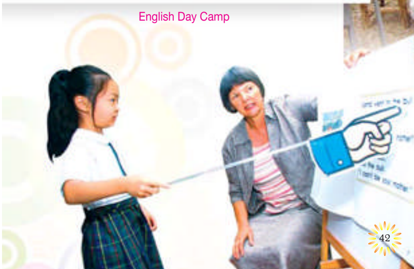
English Day Camp