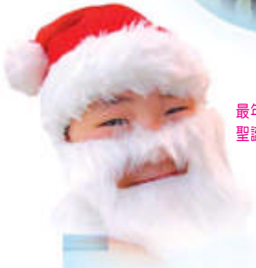
最年輕的聖誕老人