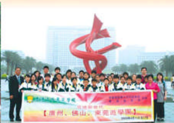
東莞市政府前留影