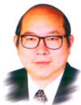
前教育署署長 李慶輝先生