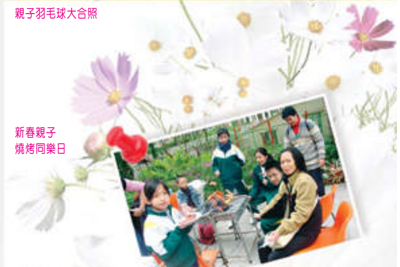
新春親子燒烤同樂日