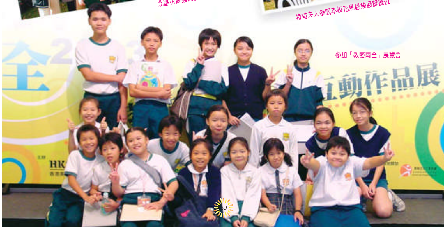
參加「教藝兩全」展覽會