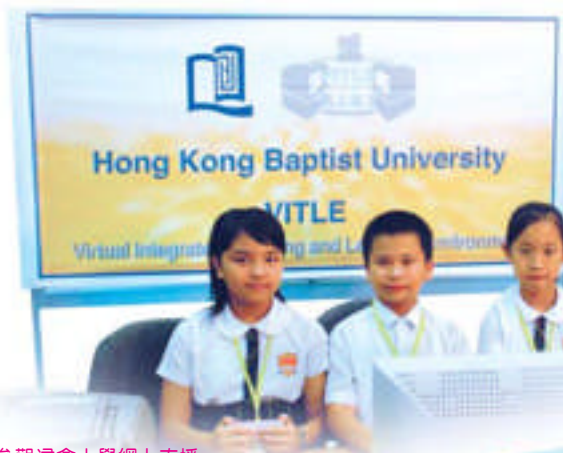
參觀浸會大學網上直播