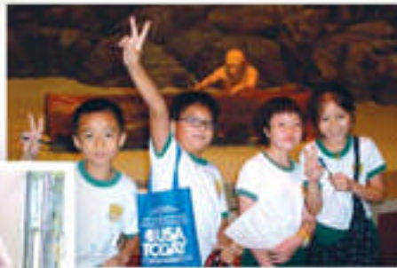
參觀香港歷史博物館