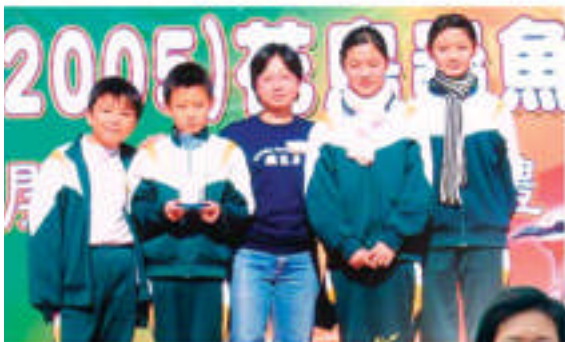
花鳥蟲魚展覽會 展覽攤位

再生能源的應用是未來的大趨勢。是年，本校成功獲「環境及自然保育基金」撥款籌劃「太陽能灑水和照明系統」。是項計劃是利用太陽能發電及照明，並把已荒廢的水井作灌溉用途。此計劃的目的除了減少用電外，還希望提升本校學生對再生能源的認識，培養學生珍惜資源，愛護環境，將所學的知識應用在日常生活中。