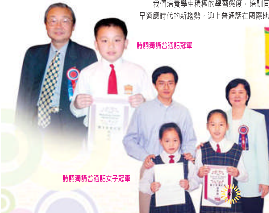
詩詞獨誦普通話女子冠軍

我們培養學生積極的學習態度，培訓同學能說流利的普通話，目的是希望同學能及早適應時代的新趨勢，迎上普通話在國際地位上的提升。