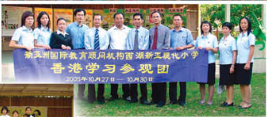
2005年新亞洲 國際教育機構 教師交流團