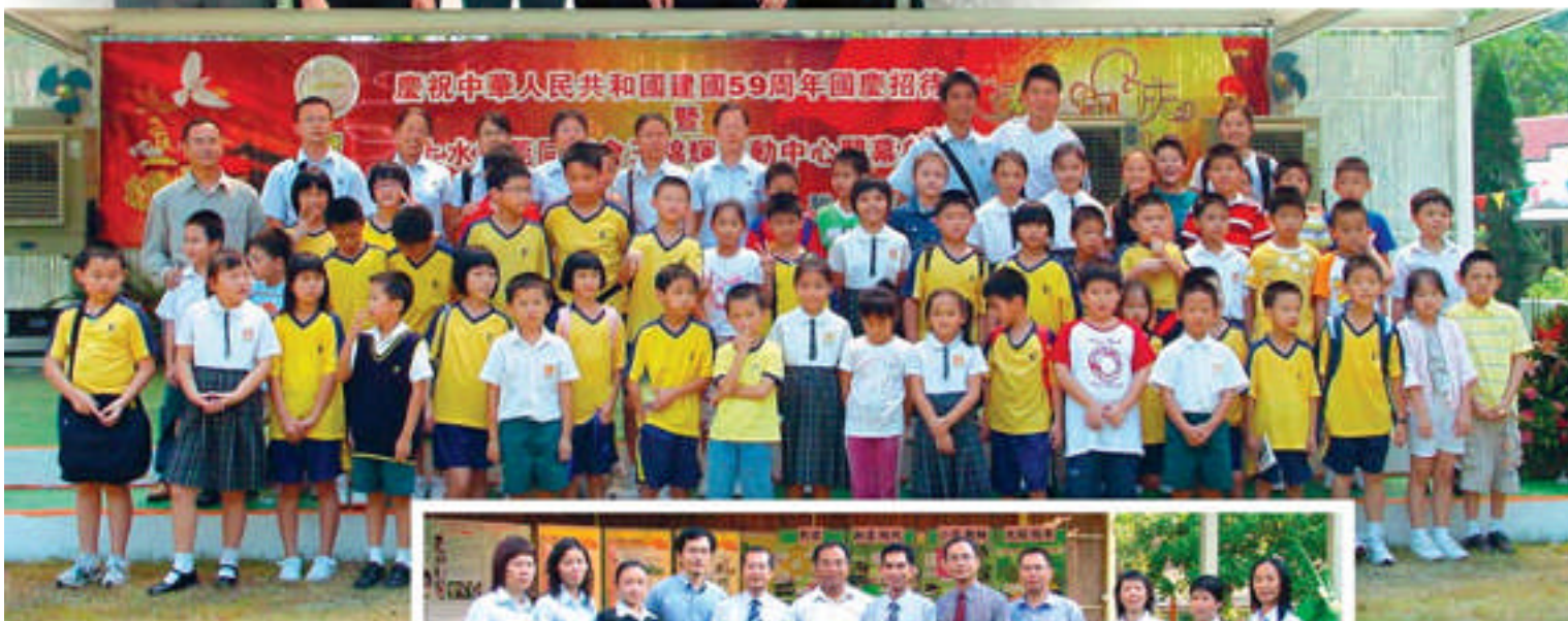
2008年東莞市外語學校到訪