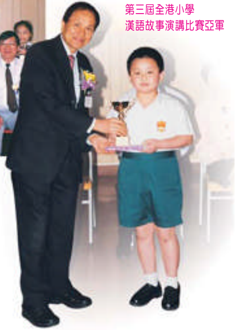
第三屆全港小學漢語故事演講比賽亞軍

1988 年，我校在第二學習階段開辦普通話科。隨着香港回歸，於一九九九年，學校把普通話課程推廣至第一學習階段。