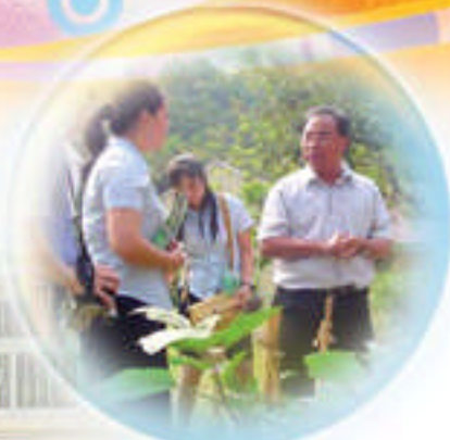
中文大學可持續發展教育小組陪同 澳洲環保教育專家到本校探訪