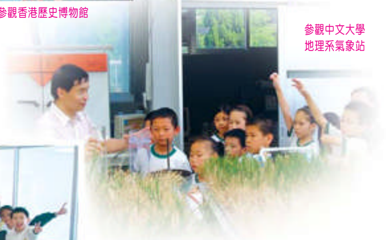
參觀中文大學地理系氣象站