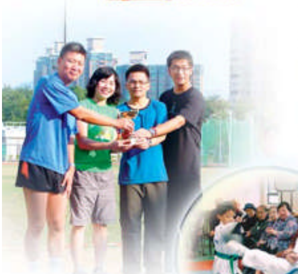
體育組四位老師勇奪 北區教師接力賽季軍