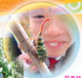
昆蟲特攻隊 觀察龍眼雞