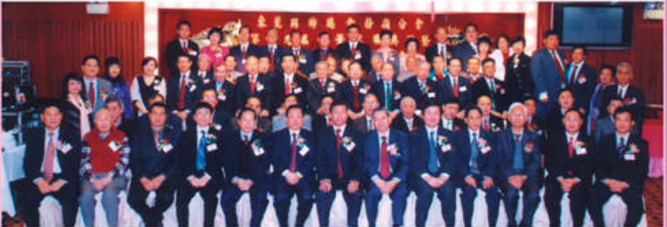
本會第十九屆會董就職典禮暨會員聯歡晚會中央政府官員、地區官員、莞邑首長及全體會董留影

粉嶺分會創會於1968年，過去幾十年以來，前輩首長團結一致，出錢出力，服務鄉親，自置有會所。