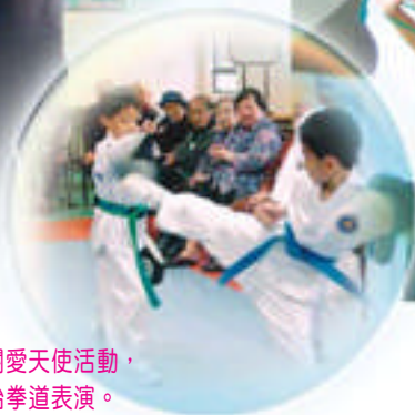
關愛天使活動， 跆拳道表演。

在體育課堂，學生接觸不同的體育運動，從而培養他們對體育活動之興趣，並建立良好態度，讓其積極地在日常生活中參與運動和鍛鍊，養成對運動的正確態度及經常運動的習慣。