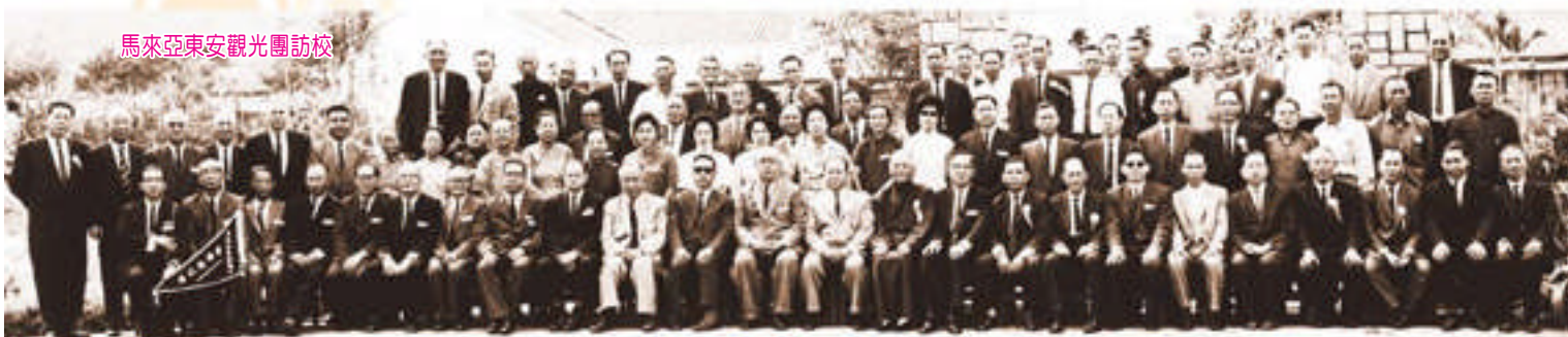
馬來亞東安觀光團訪校