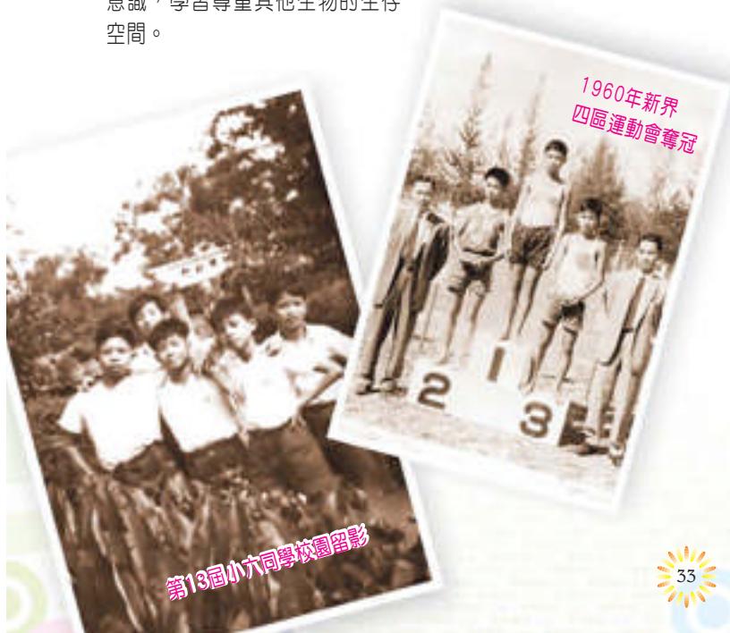
六十年代畢業同學 向母校致送紀念品

一所鄉村小學，在短短五十年間，得歷任校監、校董的帶領；眾家長、老師們的同心協力，向着「以勤為本，以孝持身，盡忠任事，存誠待人」的目標邁進，攜手把一所平房式的校舍，擴展成現今充滿田園氣息的小學—在簡樸中見自然，在園林中見生趣—為我們下一代播下「勤、孝、忠、誠」的種子。盼望在不久的將來，這批莘莘學子，能學有所成，為社會作棟樑。