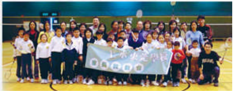
親子羽毛球大合照